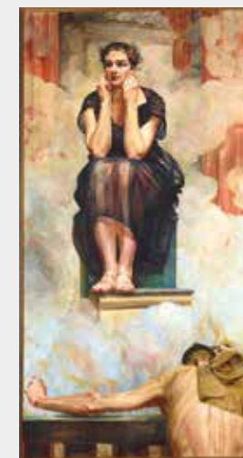
Jacek Malczewski, Piłsudzki, 1917

Na ekspozycji będą prezentowane różnorodne dzieła sztuki odnoszące się do historii zmagania o niepodległość od średniowiecza po XX wiek. Będą to symbole państwowości z okresu Piastów, ikonografie zwycięskich bitew, walk powstańczych, pomniki bohaterów narodowych, a także przykłady pracy konspiracyjnej i organicznej w wieku XIX i XX. Zostaną pokazane także dzieła sztuki ilustrujące kluczowe postaci związane z troską o odzyskiwanie i zachowanie niepodległości, od Pawła Włodkowica, przez Piotra Skargę, konfederatów barskich czy twórców niepodległościowego podziemia w czasach „Solidarności”. Wystawa potrwa do 27 stycznia 2019 r. ●