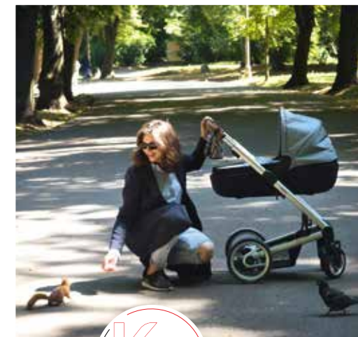
Na spacerze w parku

Jestem zdania, że pieniądze są po to, aby je wydawać i nimi obracać. Ale oczywiście staram się nimi mądrze gospodarować. Odkładam środki na przyszłość swoją i moich dzieci. ●