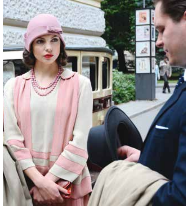
Plan zdjęciowy serialu „Bodo”